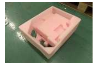
写真：サンテックフォームやエペラン緩衝材の加工例