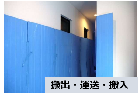
搬出・運送・搬入

床、壁、エレベーター等に養生し搬出・搬入を行います。梱包材の引取りや処分も承ります