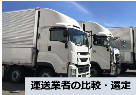
運送業者の比較・選定

精密機器物流に精通したスタッフが専任で対応します。初めてのご依頼でも安心してお任せください