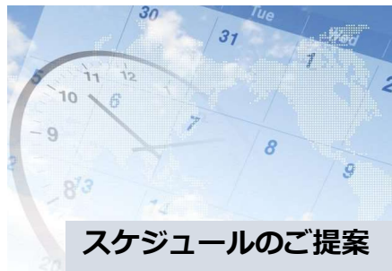
スケジュールのご提案