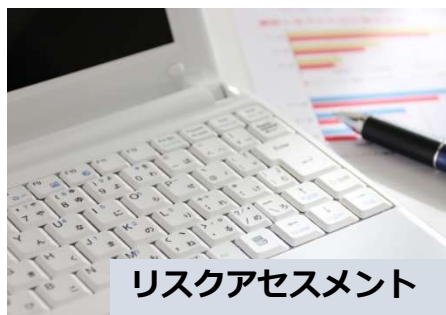
リスクアセスメント