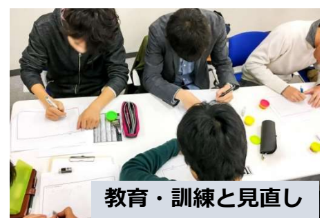
教育・訓練と見直し

作成した計画に基づき教育・訓練を実施し、演習での課題を踏まえ事業計画書の見直しを実施します