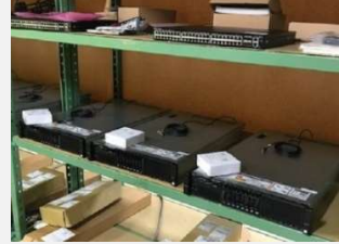
サーバーやルーターのキッティング