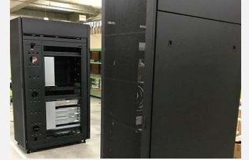
サーバーラックへのキッティング