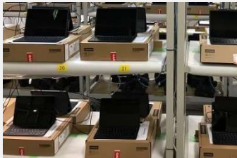
タブレットのキッティング